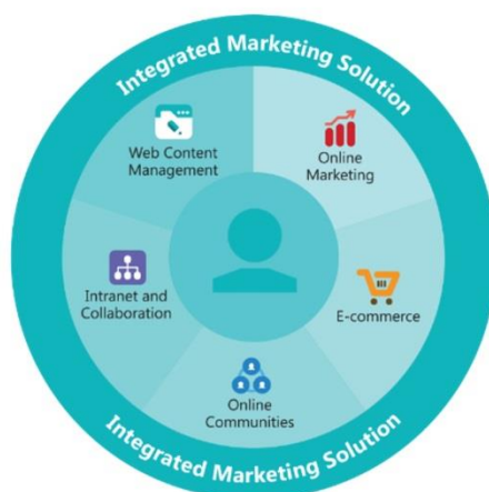
「Kentico」オールインワンソリューション

「Kentico」は2004年、EU チェコ共和国ブルノにて設立された Kentico が開発。E-Commerce や、会員管理機能、マーケティングオートメーションやペルソナ法、A/B テストなどを搭載した、CMS プラットフォームです。従来型のエンタープライズ向け CMS と比較し、Wordpress のように HTML を理解しているスキルがあれば、容易にサイトを立ち上げる事ができるので、導入コストが下がり欧米では既にシェアが急速に拡大しております。